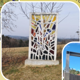
Dorfplatz Rohr a.d. Raab