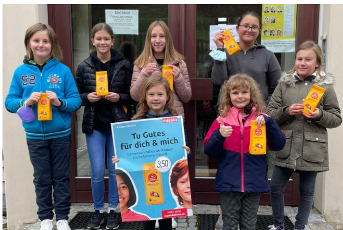
Jungchar zum Weltmissionssonntag