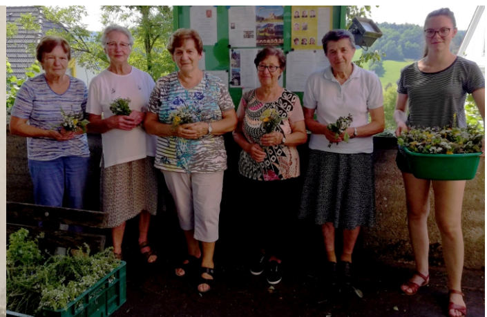
Kräutersträußen für 15. August