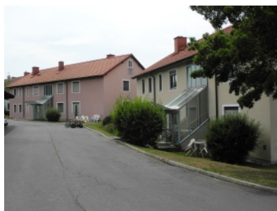
Edelsbach 185 und 186

Edelsbach 185 (ÖWG): Größe: 83,18 m 2 , Miete: € 721,58