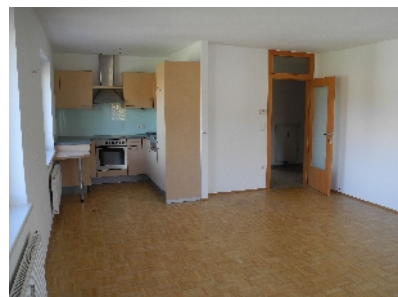
Küche Wohnung Gemeindeamt

Die Wohnungen können nach Rücksprache mit dem Gemeindeamt besichtigt werden.