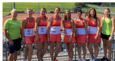
7 Fotos: Andrea Pfeifer

HIGHLIGHT DES JAHRES – MEISTERTITEL der Damen Vulkanlanddorfcup Gruppe STAD Die Zutaten: Konstante Leistung von Beginn an, Ehrgeiz und freundschaftlicher Zusammenhalt.