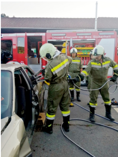
3 Fotos: Johann Zeitfogel

Trotz teilweise massiver Einschränkungen im Jahr 2020 ist es der Freiwilligen Feuerwehr Rohr an der Raab gelungen, die Einsatzbereitschaft ununterbrochen sicherzustellen. Um dies zu ermöglichen, war es im Zeitraum des totalen Lockdowns notwendig, die aktive Mannschaft in 3 Kleingruppen zu unterteilen, um stets eine Einsatzeinheit in Bereitschaft zu haben. Somit wurde sichergestellt, dass die Gruppen untereinander keinen Kontakt hatten. Im Einsatzgeschehen und bei den Monatsübungen war es dem Kommando sehr wichtig die Hygienemaßnahmen und Abstandsregeln streng zu befolgen.