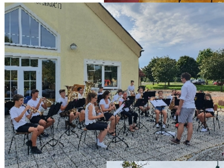
3 Fotos: Isabella Buchgraber